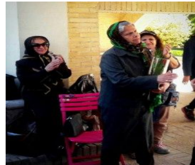
مراسم بزرگداشت روز جهانی معلم