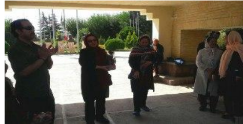
مراسم بزرگداشت روز جهانی معلم