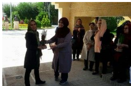
مراسم بزرگداشت روز جهانی معلم