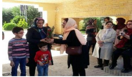
مراسم بزرگداشت روز جهانی معلم